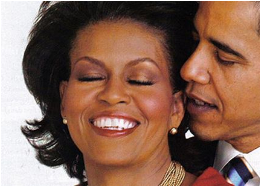
Business Club Lecture The Hague

Dienstag, 28. April 2009 um 10:01 Uhr - Aktualisiert Dienstag, 28. April 2009 um 13:21 Uhr