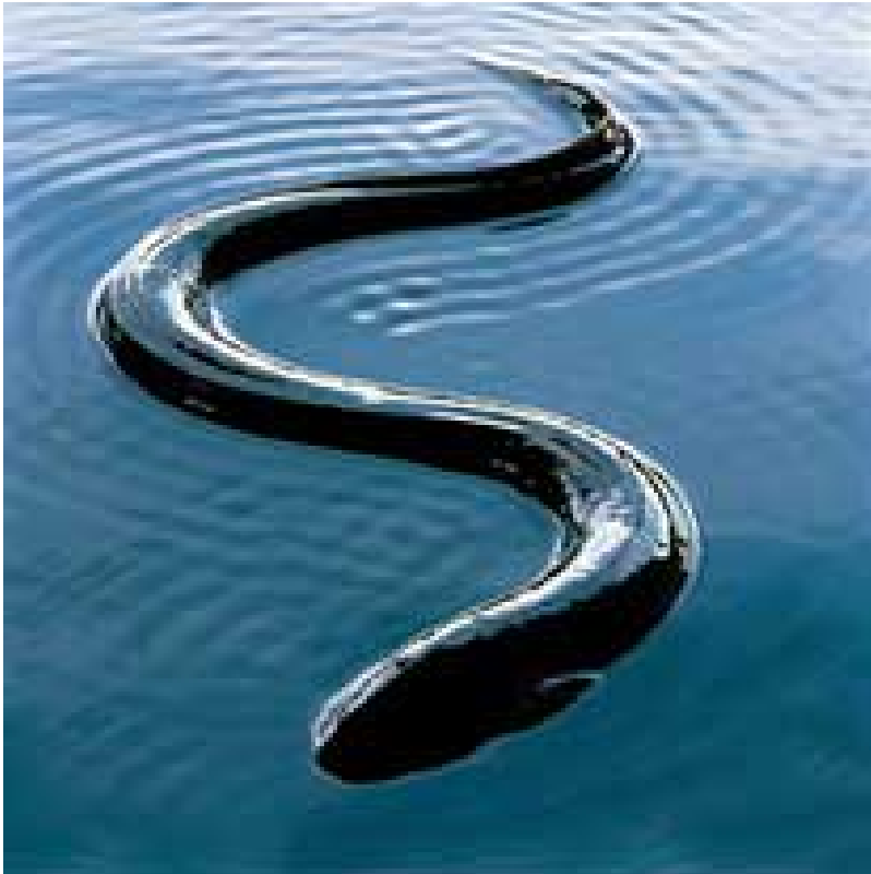
Aal vom Aussterben bedroht

Freitag, 27. März 2009 um 13:33 Uhr - Aktualisiert Samstag, 28. März 2009 um 00:45 Uhr